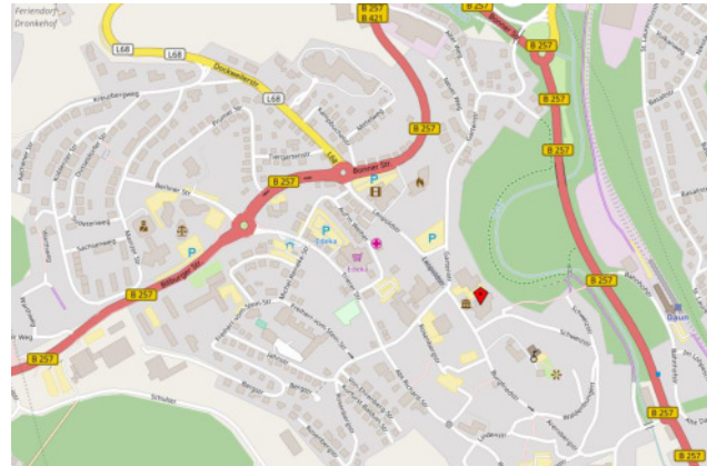
Karte hergestellt aus OpenStreetMap-Daten | Lizenz: Open Database License (ODbL)

Forum Daun Leopoldstr. 5 54550 Daun Tel.: 06592 / 9513-0